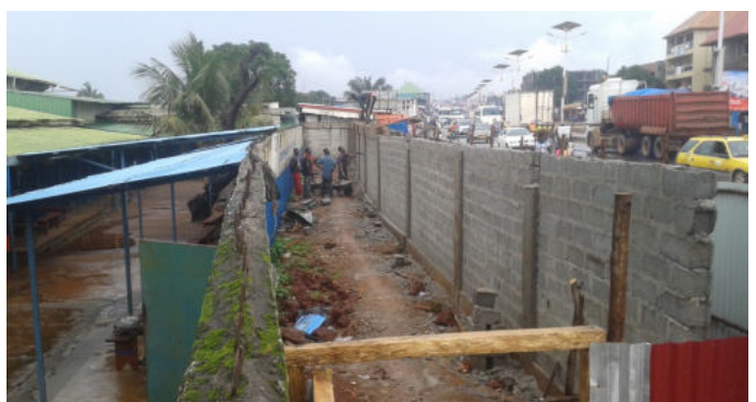
Uitbouw binnenplein voor extra 1,5 m afstand