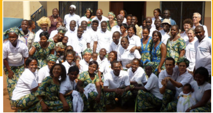
Personeel van het ziekenhuis