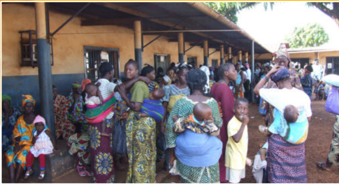
Drukke op het binnenplein