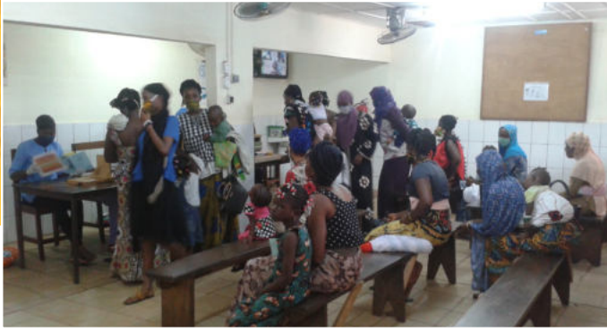
1,5 m afstand bewaren is moeilijk