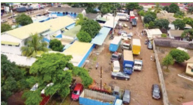
Overzicht van het terrein