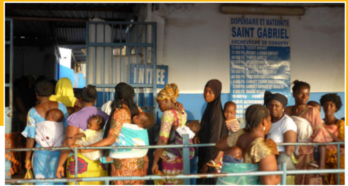
Lange rijen met patiënten